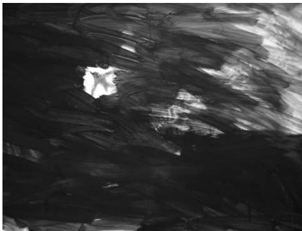
Flug ins Unbekannte